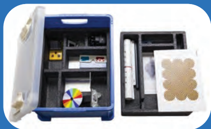
kit scientifico sugli occhi e la vista

La Giuria valuterà gli elaborati sulla base di criteri quali originalità, difficoltà nella realizzazione e coerenza con i temi di Ci Vediamo In Classe . Il giudizio della Giuria è insindacabile. I vincitori saranno contattati dalla segreteria organizzativa e saranno pubblicati sulla pagina Facebook @newaysverona