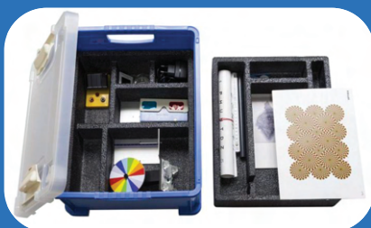
KIT SCIENTIFICO SUGLI OCCHI E LA VISTA

La Giuria valuterà gli elaborati sulla base di criteri quali originalità, difficoltà nella realizzazione e coerenza con i temi di Ci VEDIAMO IN CLASSE . Il giudizio della Giuria è insindacabile. I vincitori saranno contattati dalla segreteria organizzativa e saranno pubblicati sulla pagina Facebook @newaysverona