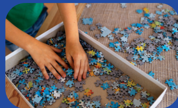
KIT PUZZLE VARI + KIT CANCELLERIA CON COLORI + KIT PIXEL ART PER ALLENARE LE ABILITÀ VISIVE DIVERTENDOSI